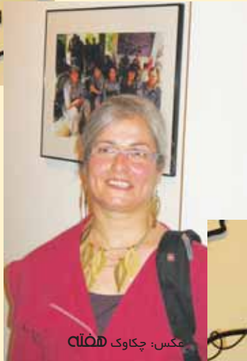
عکس: چکاوک هفتاد