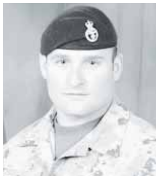
جانانان سائرلند اسنایدِر

فرماندهان وطنی و نیروهای غربی در افغانستان از مردم می‌خواهند که خوش بین باشند و ادعا دارند