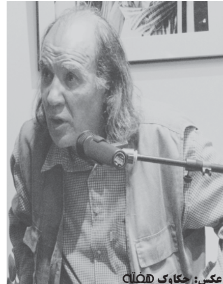
عکس: چکاوک CIOW منصور کوشان در مکیک