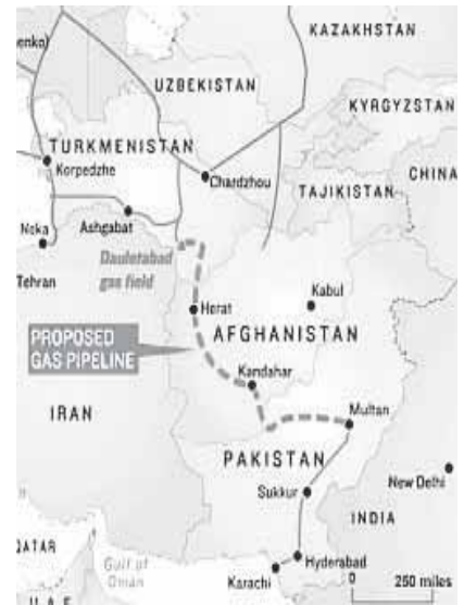
مسیر عبور خط لوله Unocal از افغانستان بخش عمده این خط لوله که هنوز احداث نشده است از قندهار می گذرد

با طالبان تازه آغاز شده است. طالبان با اقدام به حملات بیشتر در ۲۰۰۷ وارد یک مبارزه وسیع تر و عمیق تری شده است. آمریکایی ها پس از سالها مخالفت با نظرایچ میان سیاستمداران افغانی که به مذاکره با طالبان دعوت می کردند، اخیرا بیشتر و بیشتر با این نظر از در دوستی درآمده و در راه مذاکرات غیررسمی گام برداشته اند.